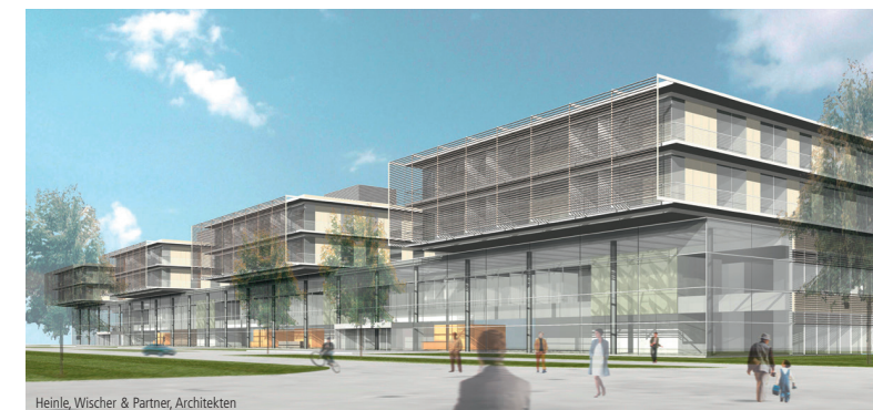
Heinle, Wischer & Partner, Architekten